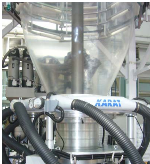
“Anlage mit Gegenstromkühlring KARAT COM3 “

Der nach Unten gegen die Folienlaufrichtung gerichtete Luftstrom (Gegenstrom) sorgt für eine Vorkühlung des Folienhalses, die beiden nach oben austretenden Luftströme arbeiten wie ein traditioneller Duallippen-Kühlring in Laufrichtung der Folie.